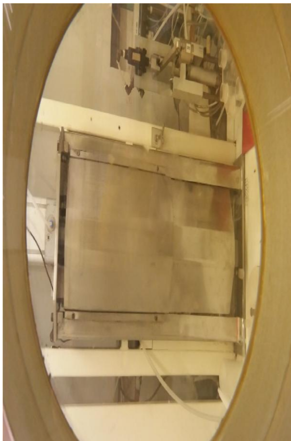
Figura 4 - Equipamento 04