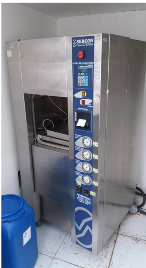
Figura 1 - Equipamento 01